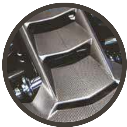
SPECIAL CARS E AUTO ELETTRICHE

Nuovi sistemi di stampaggio consentono di estendere l'utilizzo della fibra di carbonio su più larga scala.