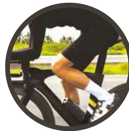
ARTICOLI SPORTIVI E ACCESSORI